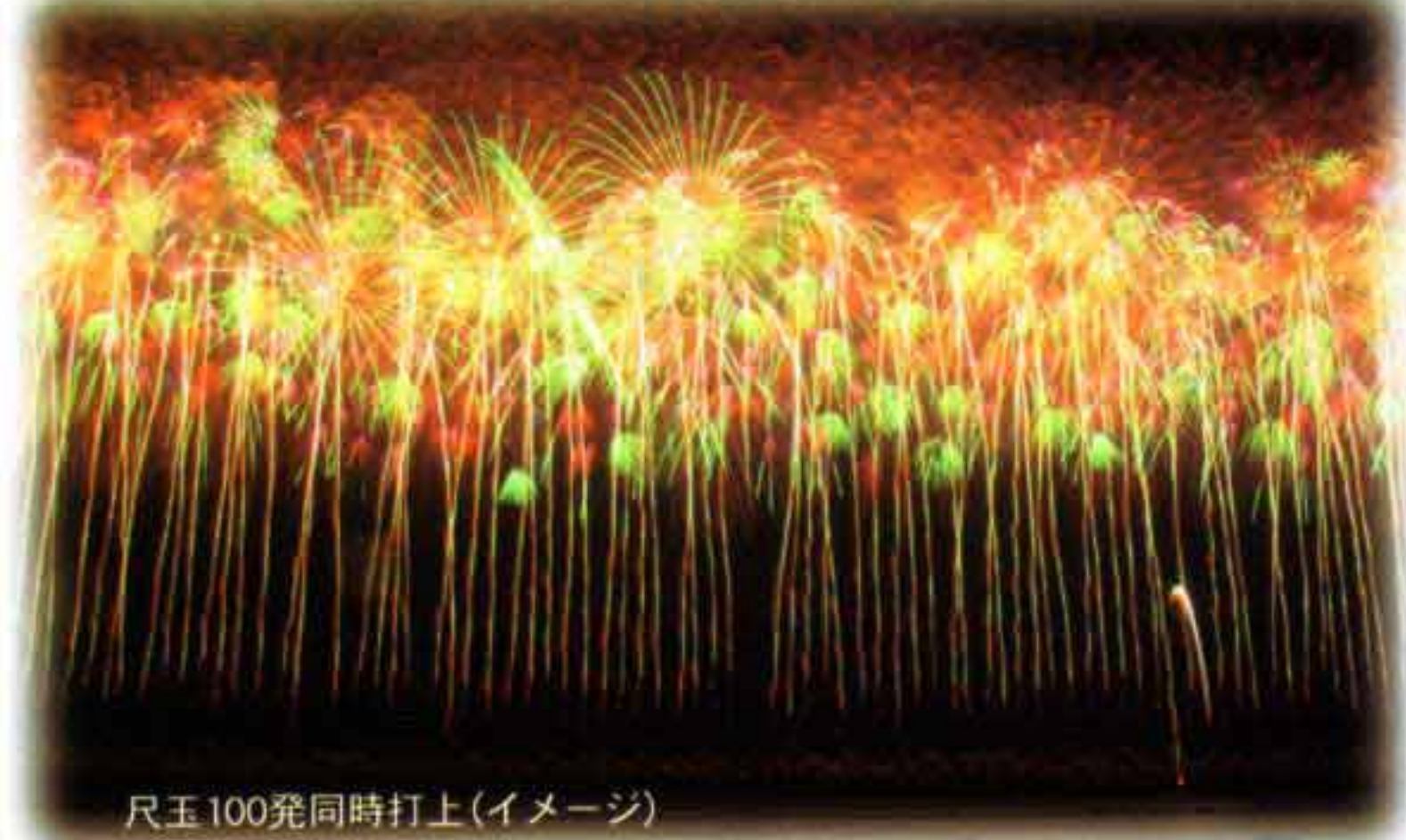
尺玉100発同時打上(イメージ)

総トン数 約26,518トン 全長 約183.4m 幅 25.0m 客室数 246室 旅客定員 644名 船員 204名