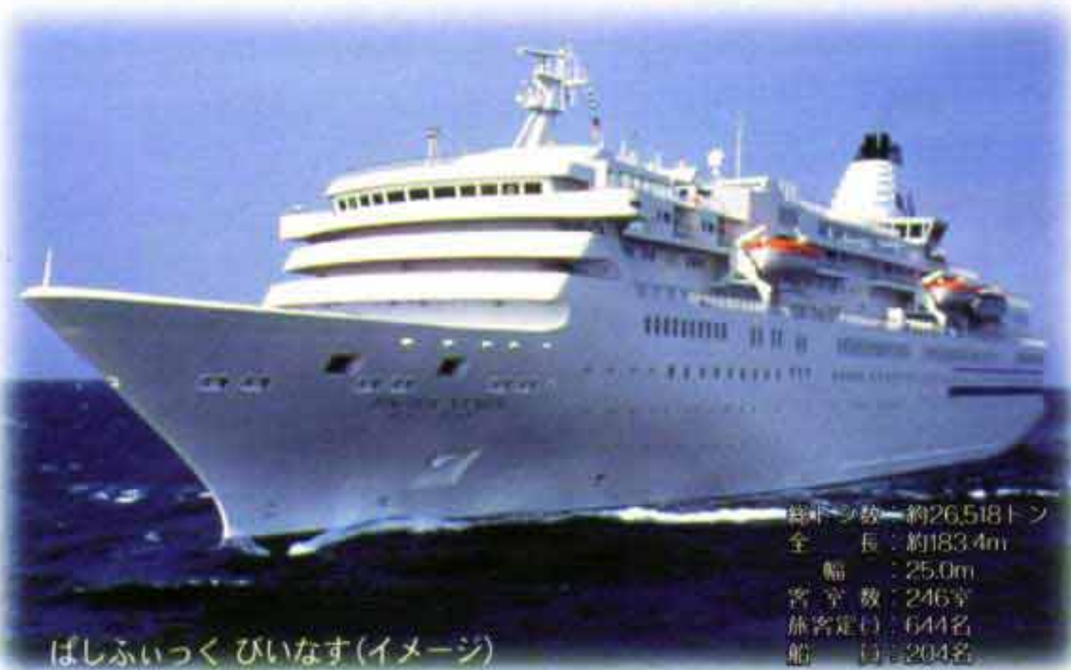
ばしふいっくびいなす(イメージ)

総トン数 約26,518トン 全長 約183.4m 幅 25.0m 客室数 246室 旅客定員 644名 船員 204名